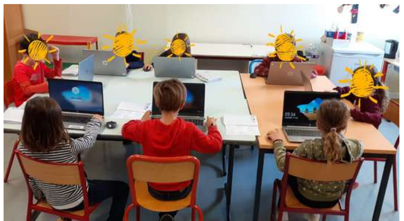
Les élèves utilisent les nouveaux équipements informatiques de l'école

L'endettement s'établit à 647k€ à fin 2023 soit 468€/habitant. La commune n'a pas fait de nouvel emprunt en 2023 et l'encours de la dette s'est réduit de 62k€. Pour les investissements 2023, les taux des emprunts étant élevés, la stratégie a été de ne pas emprunter et la commune a donc eu recours à l'autofinancement.