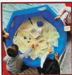
Jeux de transvasement